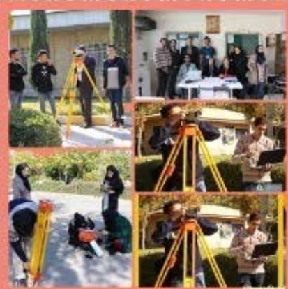
برگزاری سومین دوره مسابقات نقشه برداری

سومین دوره مسابقات بزرگ نقشه برداری دانشگاه اصفهان همراه با همایش بزرگ "نقشه برداری، دانشگاه، بازار کار" به همت گروه مهندسی نقشه برداری و انجمن علمی گروه نقشه برداری و با همکاری دفتر علمی پژوهشی کیان تراز، شنبه ۱۱ آبان- ماه ۱۳۹۸ در دانشگاه اصفهان برگزار شد.