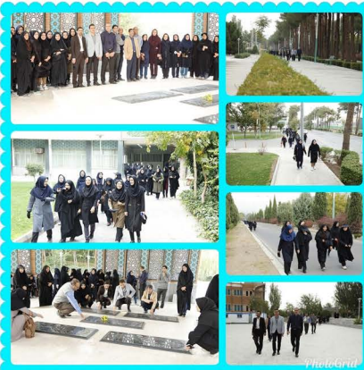
همایش پیاده روی در دانشگاه اصفهان

همایش پیاده روی ویژه دانشگاهیان، به مناسبت گرامیداشت هفته تربیت بدنی و هفته سلامت زنان، به همت معاونت دانشجویی (اداره تربیت بدنی) در دانشگاه اصفهان برگزار شد.