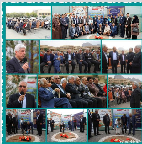
مراسم کلنگ زنی و احداث ساختمان حقوق و علوم سیاسی در دانشگاه اصفهان

دومین دوره مسابقه ملی نبرد اپلیکیشن‌ها روز چهارشنبه ۲۴ مهر ۱۳۹۸ ساعت ۱۳ تا ۱۹ در دانشکده مهندسی کامپیوتر دانشگاه اصفهان برگزار شد.