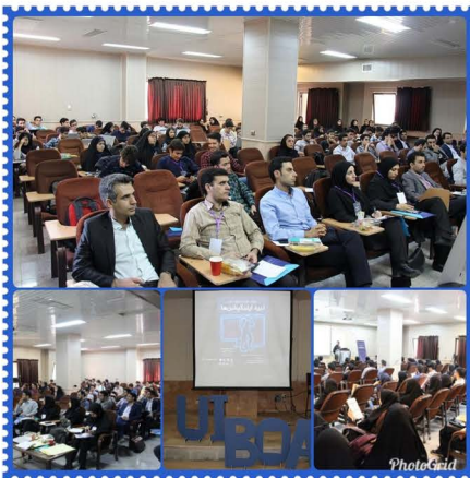
برگزاری دومین دوره مسابقه ملی نبرد اپلیکیشن‌ها در دانشگاه اصفهان

دومین دوره مسابقه ملی نبرد اپلیکیشن‌ها روز چهارشنبه ۲۴ مهر ۱۳۹۸ ساعت ۱۳ تا ۱۹ در دانشکده مهندسی کامپیوتر دانشگاه اصفهان برگزار شد.