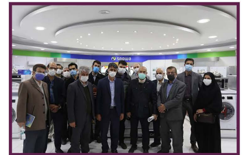
بازدید اعضای هیات علمی دانشگاه اصفهان از گروه صنعتی انتخاب

در این بازدید مدیران خطوط مختلف تولید از جمله خط تولید لباس شویی، یخچال و فریزر و تلویزیون در خصوص فرایندهای تولید توضیحات لازم را ارائه نمودند. همچنین از آزمایشگاه‌های تخصصی از جمله آزمایشگاه آکرودیته تست صدا و لرزش و واحد تحقیق و توسعه نیز بازدید به عمل آمد. گفتنی است چشم انداز هلدینگ انتخاب قرار گرفتن در زمره ۱۰ مجموعه موثر اقتصادی اجتماعی ایران اسلامی