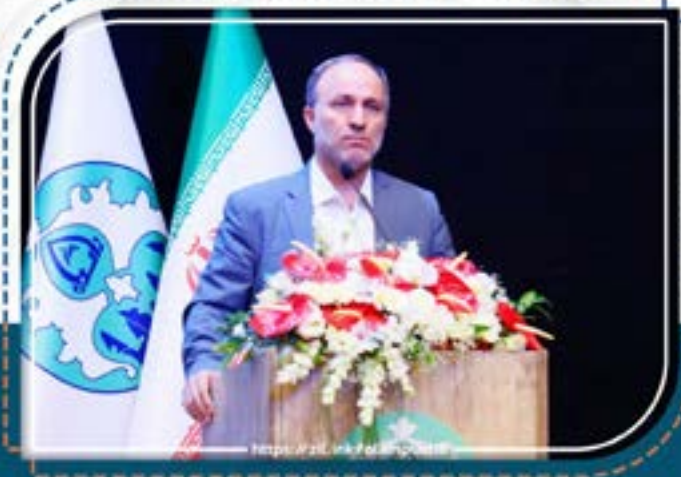
معاون وزیر علوم، تحقیقات و فناوری