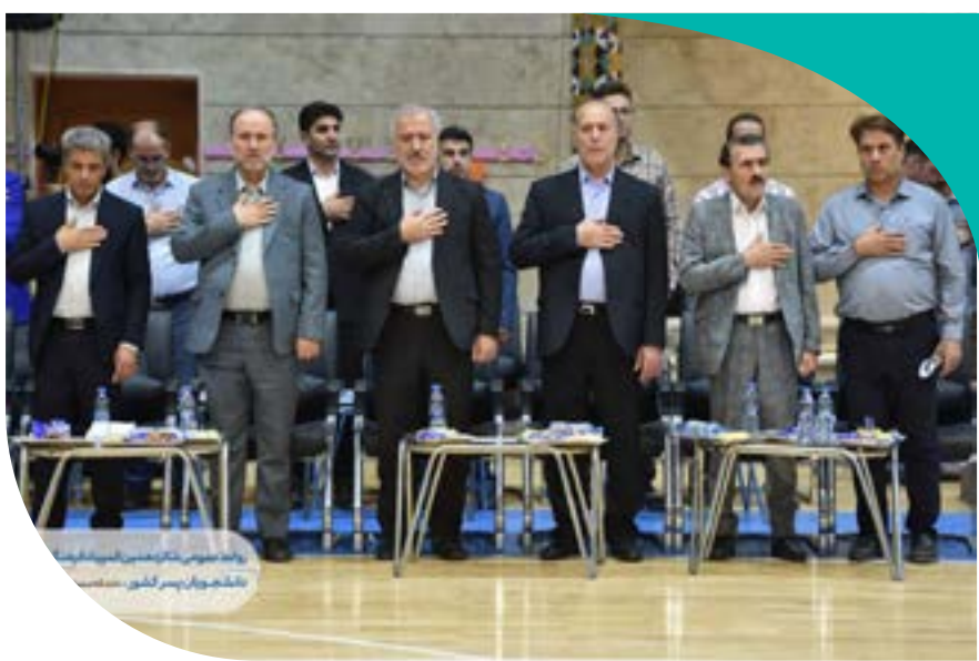
روابط عمومی شانزدهمین المپیاد فرهنگی ورزشی دانشجویان پسر کشور - دانشگاه اصفهان