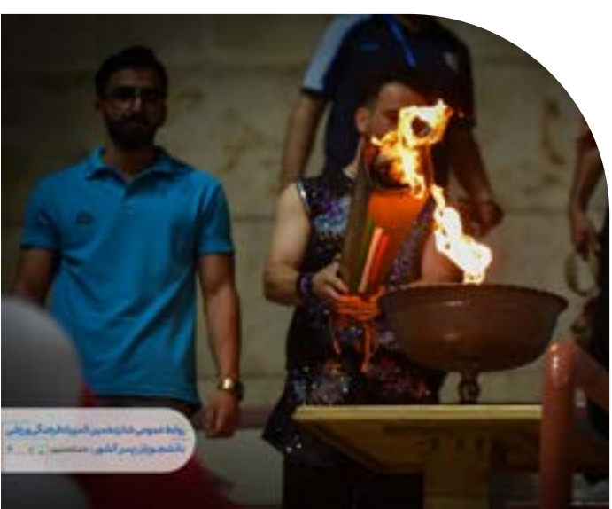
روابط عمومی شانزدهمین المپیاد فرهنگی ورزشی دانشجویان پسر کشور - دانشگاه اصفهان