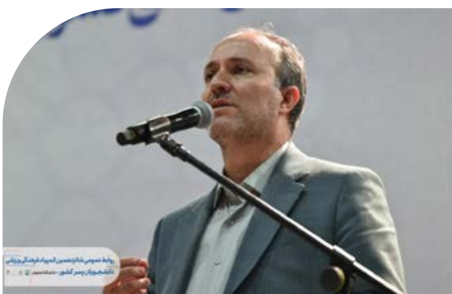
روابط عمومی شانزدهمین المپیاد فرهنگی ورزشی دانشجویان پسر کشور - دانشگاه اصفهان