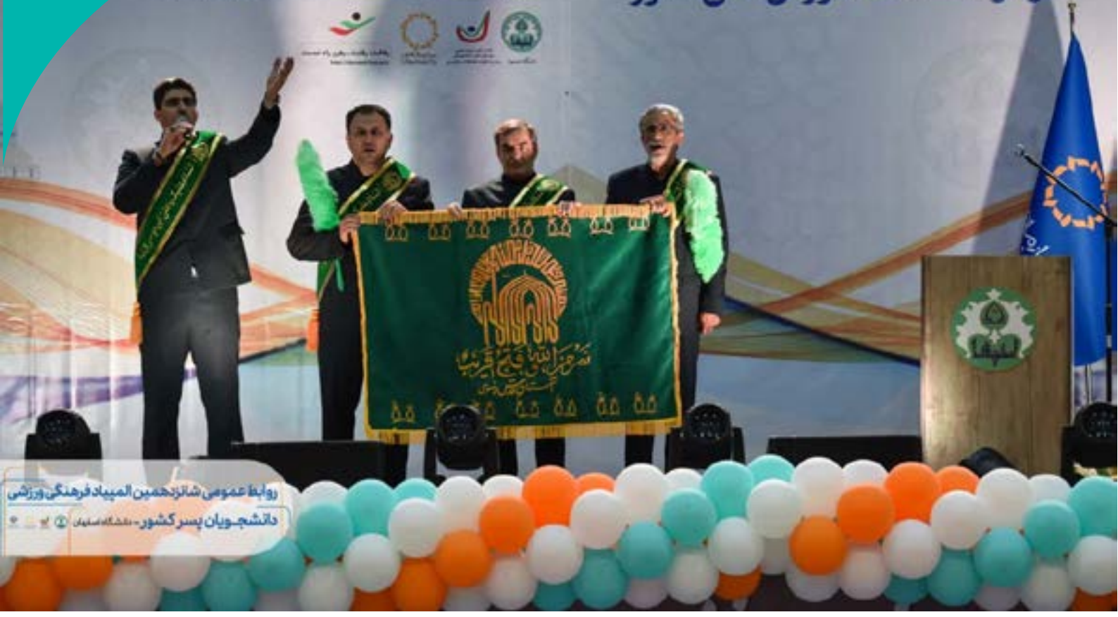
روابط عمومی شانزدهمین المپیاد فرهنگی ورزشی دانشجویان پسر کشور - دانشگاه اصفهان