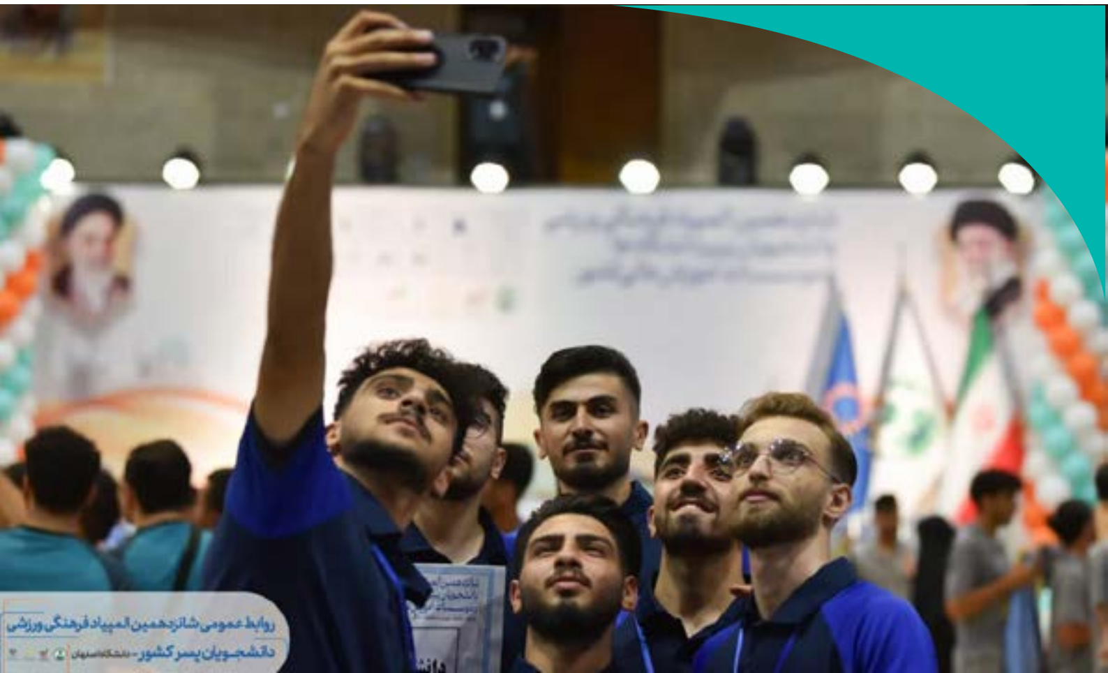
روابط عمومی شانزدهمین المپیاد فرهنگی ورزشی دانشجویان پسر کشور - بنگاه سهند