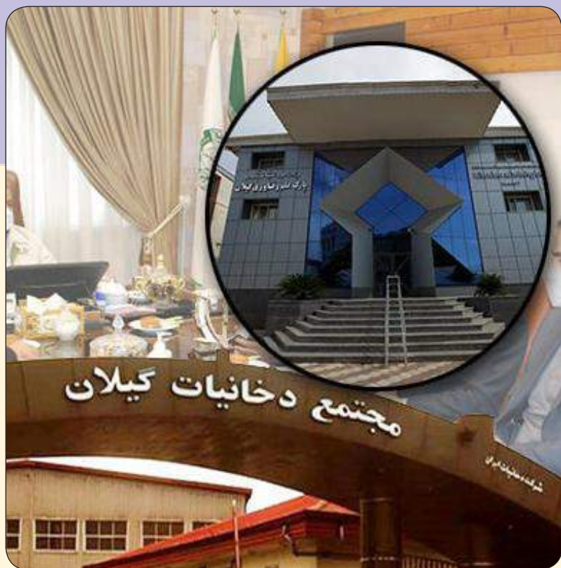
مجتمع دخانهیات گیلان