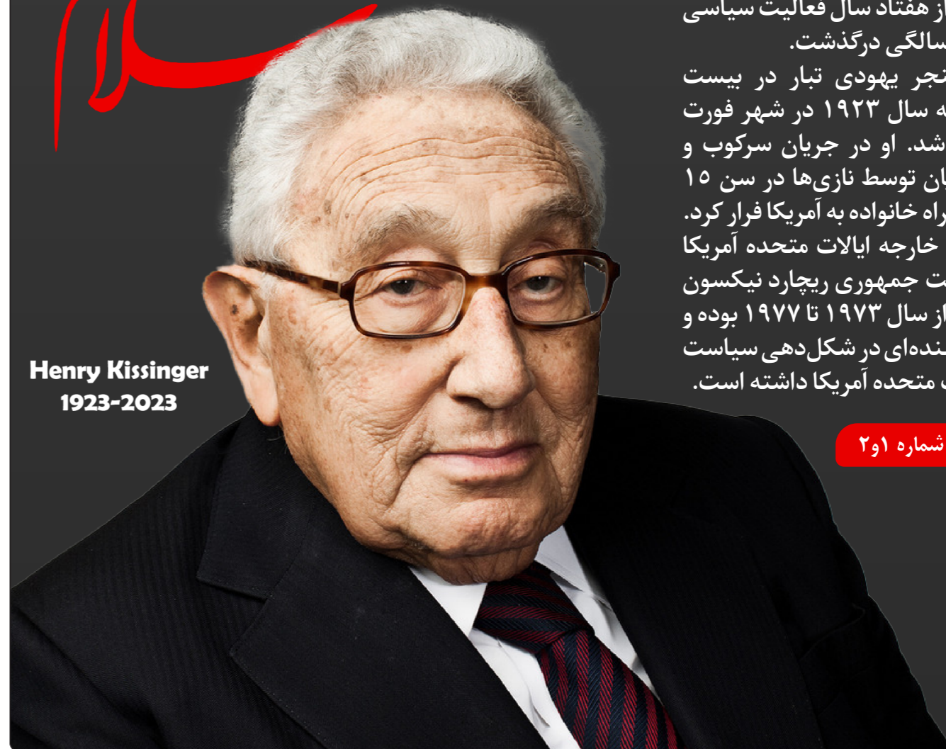
Henry Kissinger 1923-2023