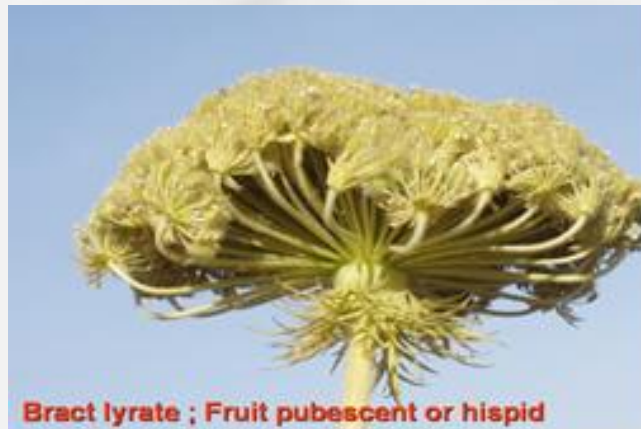
فرزانه فروهر فر